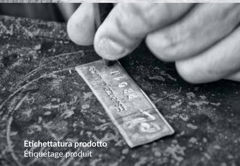
Etichettatura prodotto Étiquetage produit