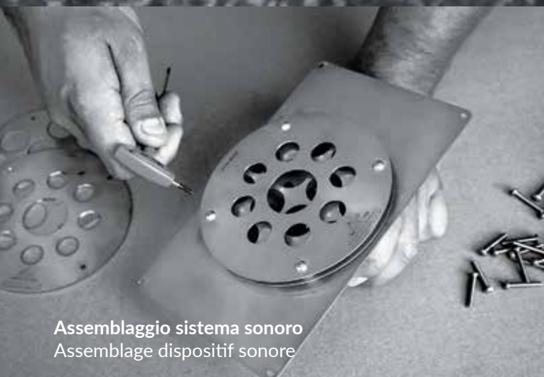
Assemblaggio sistema sonoro Assemblage dispositif sonore

OGNI PRODOTTO È UNICO...COME UNICO È IL MATERIALE DI PARTENZA