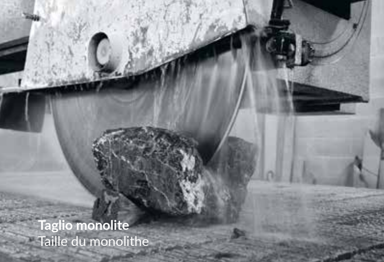
Taglio monolite Taille du monolithe