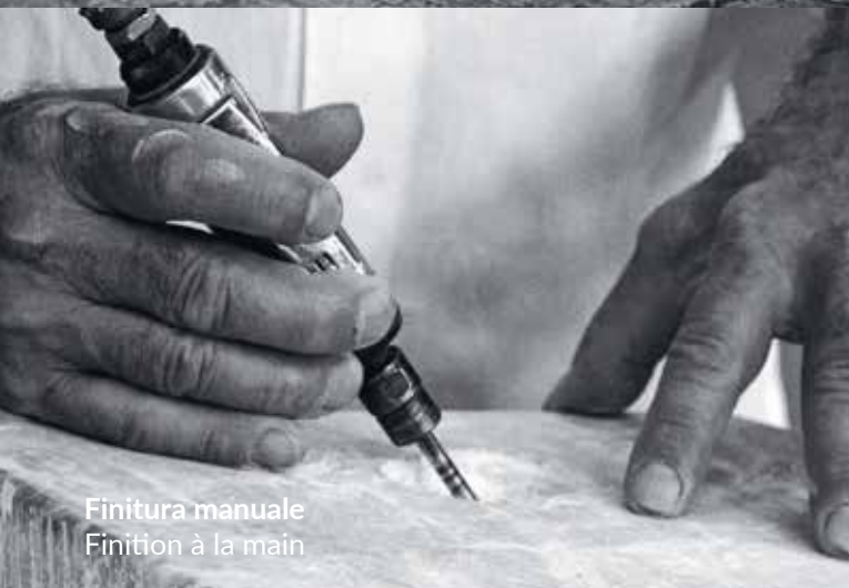
Finitura manuale Finition à la main